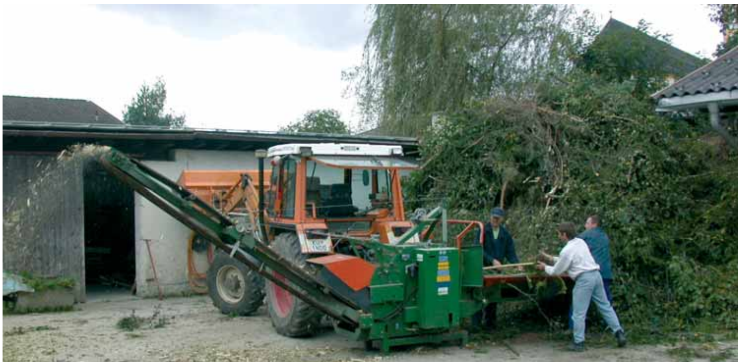
Der Gemeindebauhof beim Häckseln von Baum- und Strauchschnitt