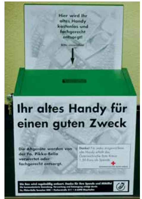
Sammelbox beim Recyclinghof

Und das Ganze dient darüber hinaus noch einem guten Zweck, denn für jedes gesammelte Mobiltelefon erhält das Österreichische Rote Kreuz EUR 1,50. Dabei ist es egal, ob das Gerät funktioniert oder nicht. Durch dieses Sammelsystem konnten die humanitäre Arbeit und vielfältigen Projekte für Sozial- und Hilfeleistungen des Roten Kreuzes österreichweit mit bislang ca. EUR 70.000,00 unterstützt werden. Das Sammelsystem wird laufend erweitert und ausgebaut. So sollen Ende 2006 in Österreich bereits über 2.000 Standorte für die Abgabe der Handys existieren. Weitere Sammelstellen gibt es neben dem Recyclinghof Ebbs unter anderem in allen Hartlauer-, Telering- und Telekom-Filialen sowie in sämtlichen Dienststellen des Roten Kreuzes.