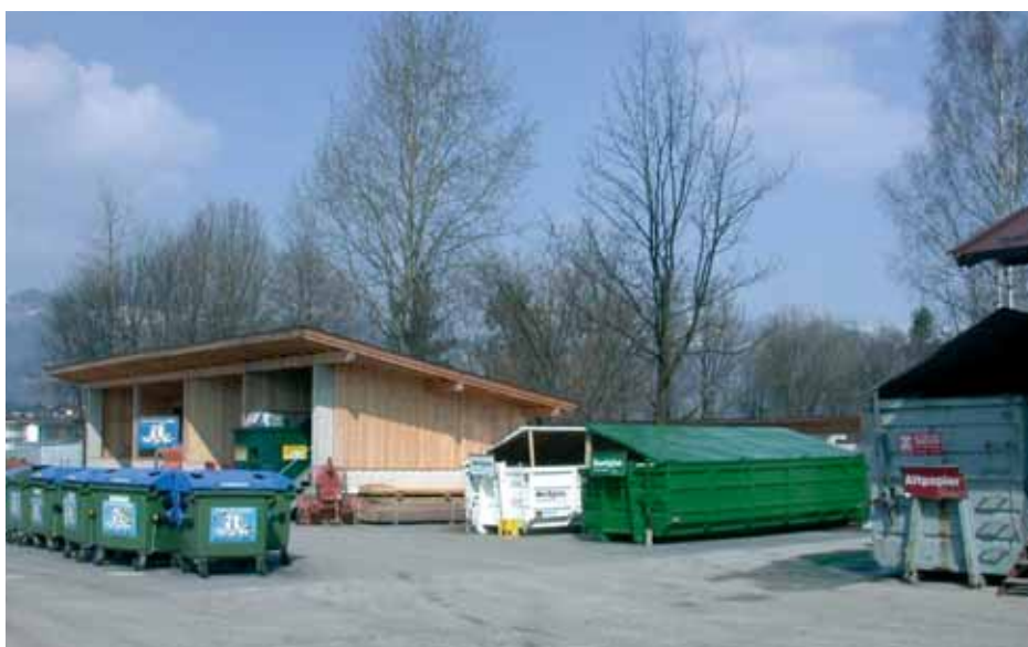
Der Recyclinghof der Gemeinde Ebbs

Am Montag, den 16. Oktober 2006 ist der Recyclinghof aufgrund der Altkleidersammlung ganztägig von 7.00 bis 12.00 Uhr und von 13.00 bis 18.00 Uhr geöffnet.